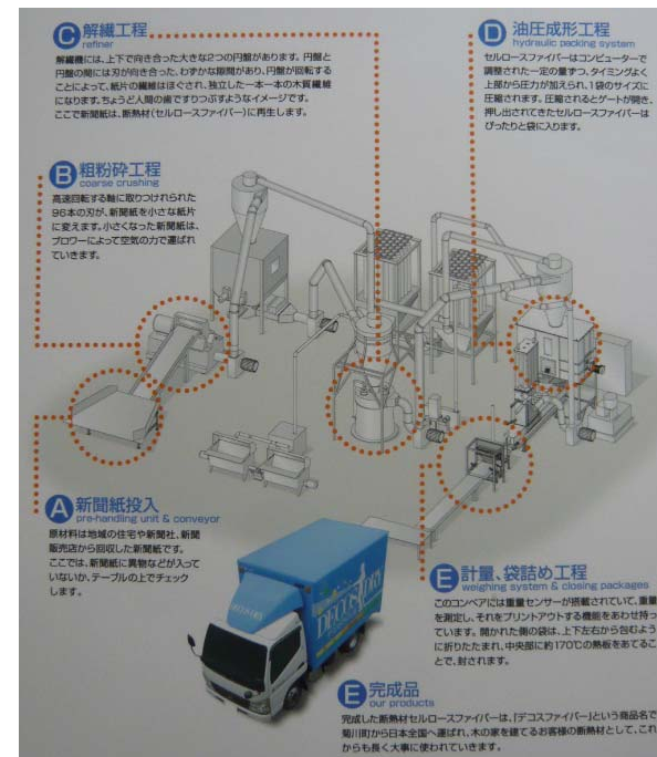
製造ラインイメージ