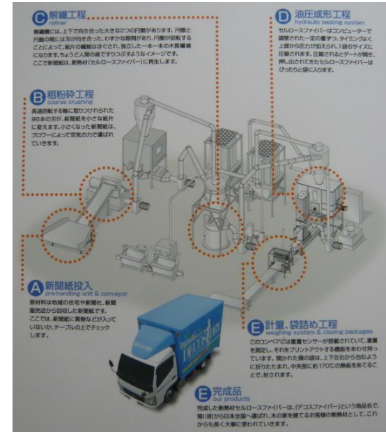
製造ラインイメージ