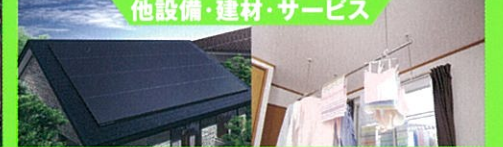
他設備・建材・サービス