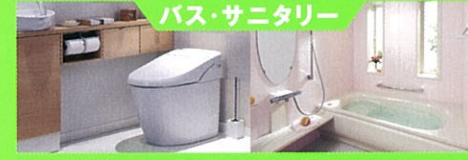
バス・サニタリー