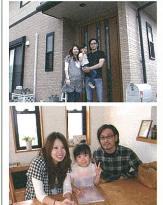
新築時に自社製品を採用して断熱性や吸音性の高さを実感しているという山口県Hさん

■この商品の価格 5940円/m 2 ~ (補足) 材料と工事費を含んだ屋根・壁・床、密度55K(厚み100mm程度)の場合