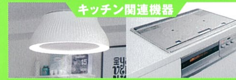
キッチン関連機器