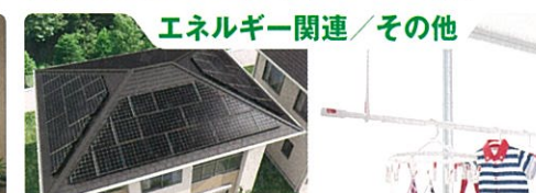
エネルギー関連/その他