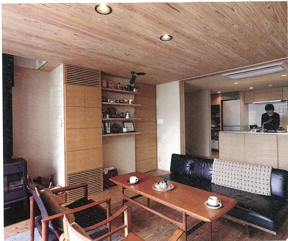
断熱にはこだわりがあったというYさん。こんなに断熱材を入れる人は初めてと工務店に言われたほど。「おかげで冬は暖かく、夏は涼しい。家は街の中に建っているのですが、室内はとて静かです。窓を開けると全然違うので驚いています」

デコス/デコスファイバー&デコスドライ工法 「心地よい家づくり」をお考えの あなたに調湿・吸音・断熱材を！