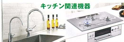
キッチン関連機器