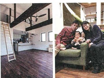
室温と外気温の1日の変化