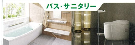
バス・サニタリー