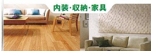
内装・収納・家具